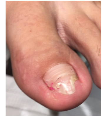
vor der Behandlung