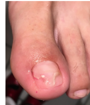
nach der Behandlung